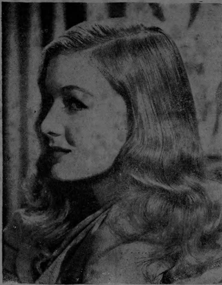
El uso de una base de maquillaje hace que el cutis luzca perfectamente por muchas horas seguidas, sin necesidad de retocarse, como en el caso de VERONICA LAKE, atractiva estrella de Paramount. Este es uno de los temas a que se refiere hoy en su crónica de belleza el conocido experto en maquillaje de Hollywood Max Factor Jr.

Tales cosméticos como la base de maquillaje y el maquillaje "pan-cake" resultan de particular importancia en estos casos porque el efecto, después de aplicado, dura por mucho tiempo y evita retoques y nuevas aplicaciones de polvos, colorete, etc., durante el día. Si la piel se ha irritado por el resfriado, más conveniente todavía resultará el evitar tales retoques y nuevas aplicaciones de maquillaje. Es inevitable, no obstante que